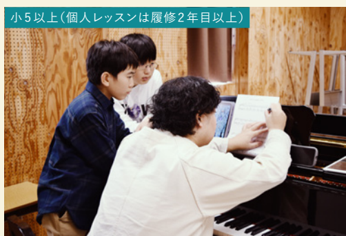
小5以上(個人レッスンは履修2年以上)

さまざまな時代やスタイルの短い曲を初見で弾くことで、譜読みのコツを習得し、音色や表情など自分の持ち味を最大限に発揮できる様にすることが目的です。