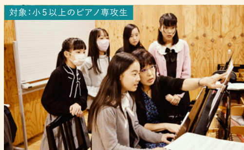
対象:小5以上のピアノ専攻生

ピアノは一人で多旋律や和声を奏でるといった特徴があります。旋律楽器専攻生がピアノに触れることによって、ハーモニー感や多くの音を多彩に聴く力を育てることを目的としています。