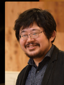
お茶の水教室 教室長

コロナ禍では、オンライン授業を教室に通う生徒さんと共に創出しました。今後も新しい教育の形への挑戦をし、次世代へ音楽文化を継承することを目指していきます。もちろん、一緒に音を楽しむために。