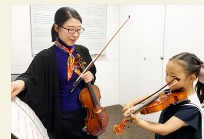
弦楽器(ヴァイオリン、チェロ)